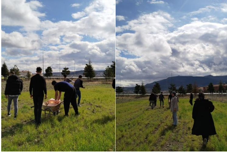
Şekil 3. 2024 Yılı Gacer Ekimi Faaliyetimiz

Uygulama alanlarımızda yeni ekim ve dikim alanlarının hazırlıkları hızla devam ediyor. Doğal tarımı desteklemek ve üretim kapasitemizi artırmak için yürüttüğümüz çalışmalar, sürdürülebilir tarım hedeflerimize katkı sunmayı amaçlıyor. Bu alanlarda yeni fidelerimizi toprakla buluşturacağız. Merkezimiz bünyesindeki uygulama alanlarımızda lavanta bahçesi çalışmalarımız tüm hızıyla sürüyor. Görsel güzelliği ve ekonomik değeriyle öne çıkan lavanta bitkisi hem çevreye katkı sağlayacak hem de doğal tarım hedeflerimize destek olacak. Yakında lavanta bahçemizin mis kokulu sonuçlarını paylaşmayı heyecanla bekliyoruz.