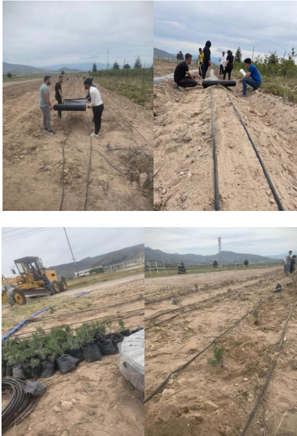
Şekil 4. 2024 Yılı Lavanta Ekim Faaliyetimiz

Uygulama alanlarımızda yeni ekim ve dikim alanlarının hazırlıkları hızla devam ediyor. Doğal tarımı desteklemek ve üretim kapasitemizi artırmak için yürüttüğümüz çalışmalar, sürdürülebilir tarım hedeflerimize katkı sunmayı amaçlıyor. Bu alanlarda yeni fidelerimizi toprakla buluşturacağız. Merkezimiz bünyesindeki uygulama alanlarımızda lavanta bahçesi çalışmalarımız tüm hızıyla sürüyor. Görsel güzelliği ve ekonomik değeriyle öne çıkan lavanta bitkisi hem çevreye katkı sağlayacak hem de doğal tarım hedeflerimize destek olacak. Yakında lavanta bahçemizin mis kokulu sonuçlarını paylaşmayı heyecanla bekliyoruz.