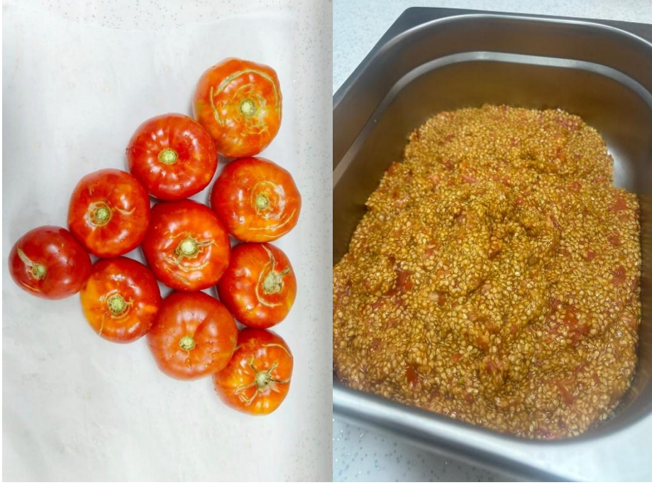
Şekil 1. 2024 Yılı Tohum Çıkarma Faaliyetimiz

Atalık tohumlarımızı koruyarak geleceğe taşıyoruz! Yeni sezon için özenle hazırladığımız doğal ve genetik çeşitliliğe sahip bu tohumlar, geleneksel tarımın ve sağlıklı üretimin temelini oluşturuyor. Merkezimiz, elde ettiği tohumlarla kendi fide üretimini gerçekleştirerek doğal ve sürdürülebilir tarıma katkıda bulunmaya devam ediyor.