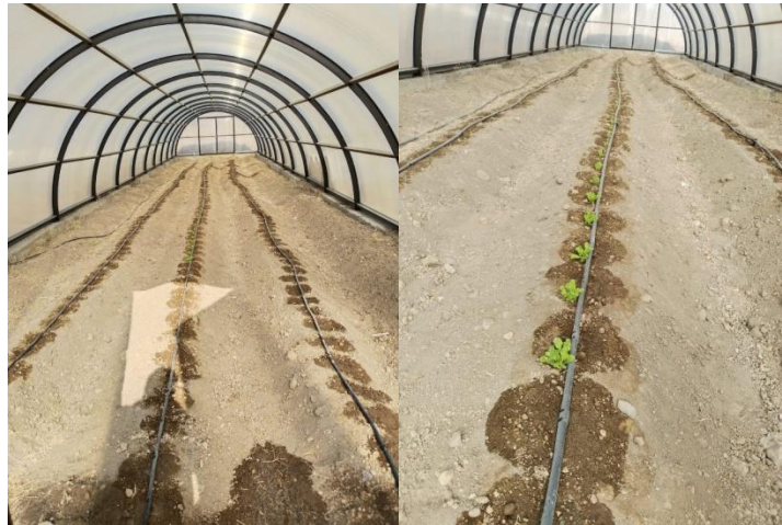
Şekil 2. 2024 Yılı Sera Ekimi Faaliyetimiz

Seralarımızda yürüttüğümüz uygulama ve araştırma çalışmalarımız tüm hızıyla devam ediyor. Doğal tarım yöntemlerini geliştirmek ve sürdürülebilir üretimi desteklemek amacıyla gerçekleştirilen bu çalışmalar, hem araştırmalara hem de öğrencilerimizin uygulamalı eğitimine katkı sunmayı hedefliyor.