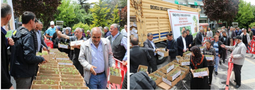
Şekil 6. Fide Dağıtım Etkinliği

Kayseri Üniversitesi, Ata Tohumu Uygulama ve Araştırma Merkezinin üretimini yaptığı Ata tohumu “Karahıdır” domates fideleri bu yıl da Develi belediyesinin destekleriyle halkımıza dağıtılmıştır.