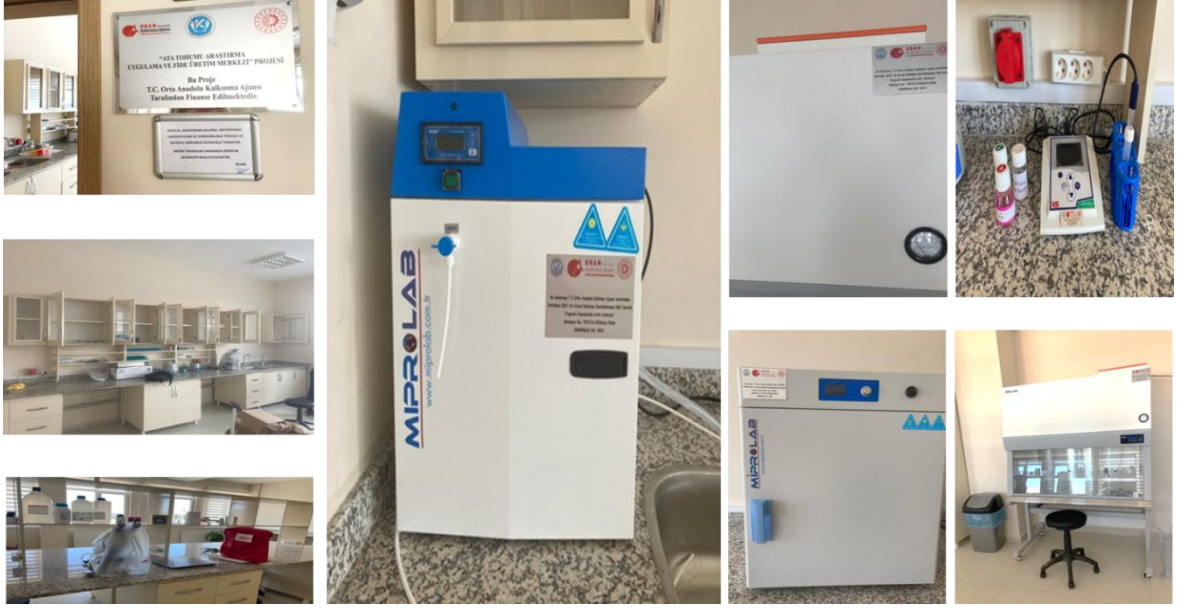
Şekil 5. Merkeze Ait Laboratuvar Genel Görünümü